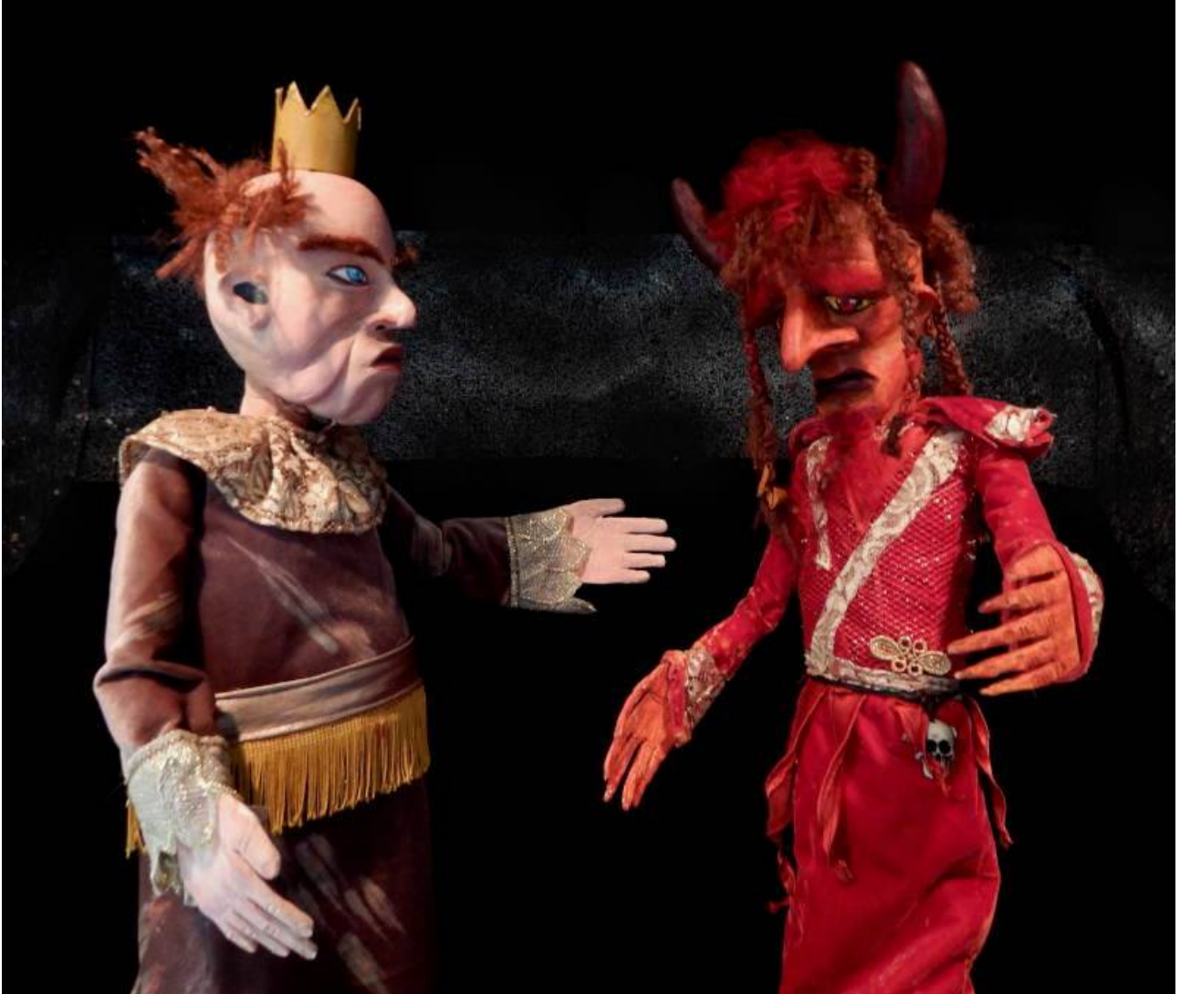
Misié Liwa avè Djab