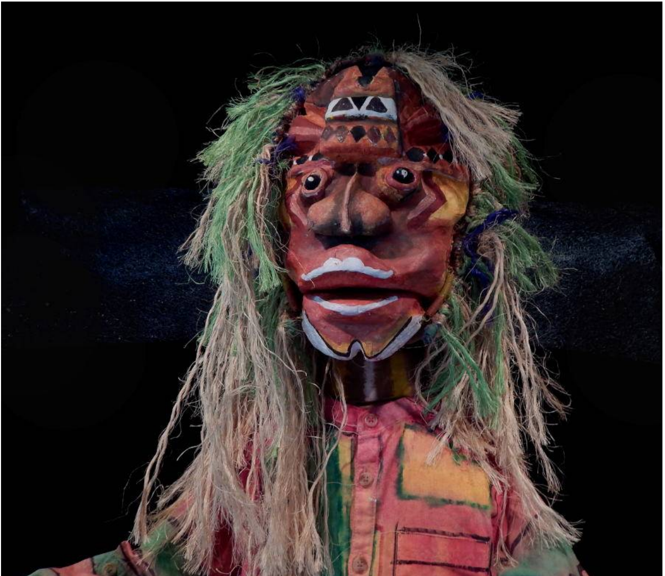
Met a kont