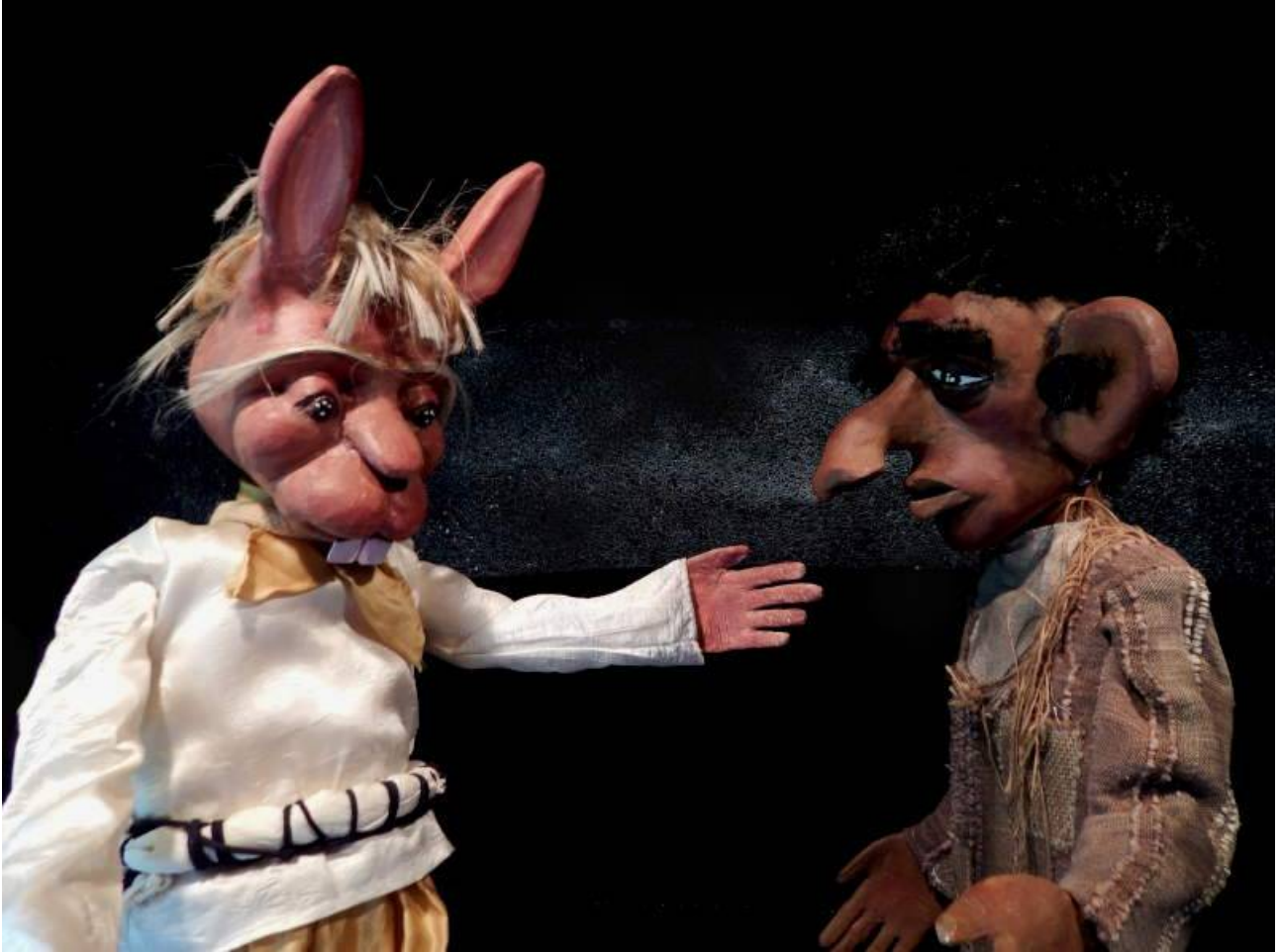
Konpè Lapen avè Konpè Zanba