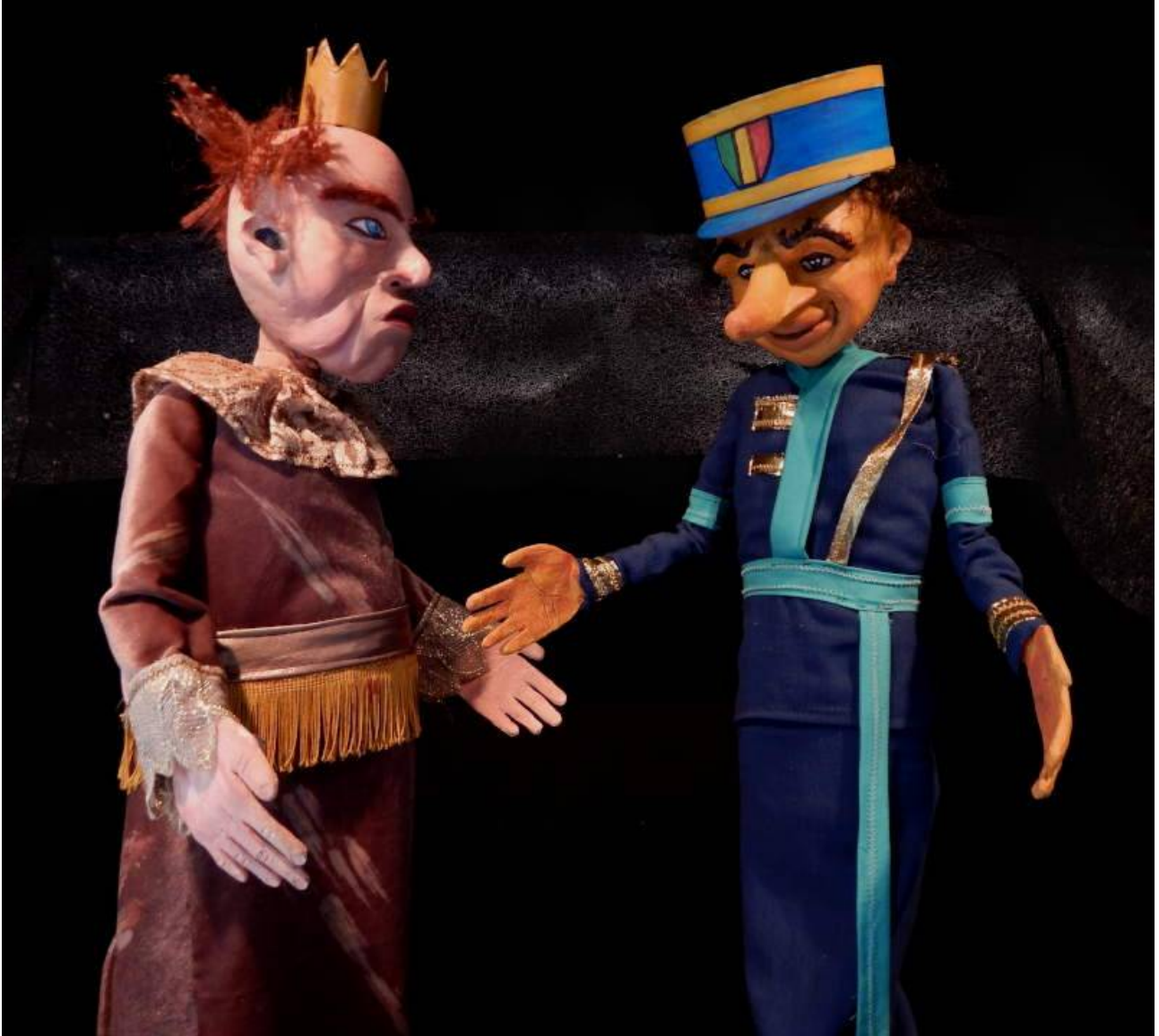
Misié Liwoi avè Lalwa